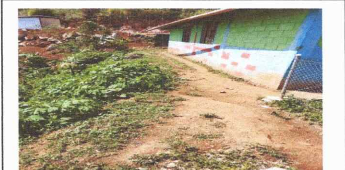
Foto 4: Se observa el desprendimiento de pintura en las paredes en el módulo I